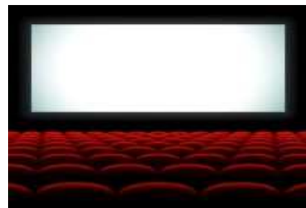
EN EL CINE