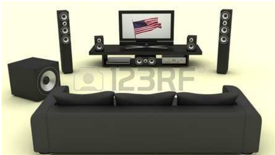
DVD, EN CASA

Es sábado, usted y su compañero quieren ver una película, pero no saben dónde. Para ello, deben elegir una de las opciones. Lea la información de la siguiente lámina y mantenga una conversación de 4-5 minutos con el otro candidato para llegar a un acuerdo.