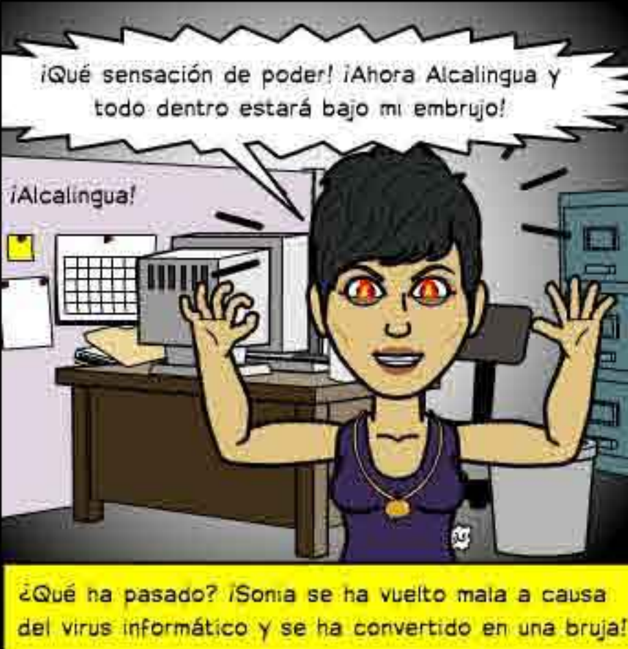
¿Qué ha pasado? ¡Sonia se ha vuelto mala a causa del virus informático y se ha convertido en una bruja!