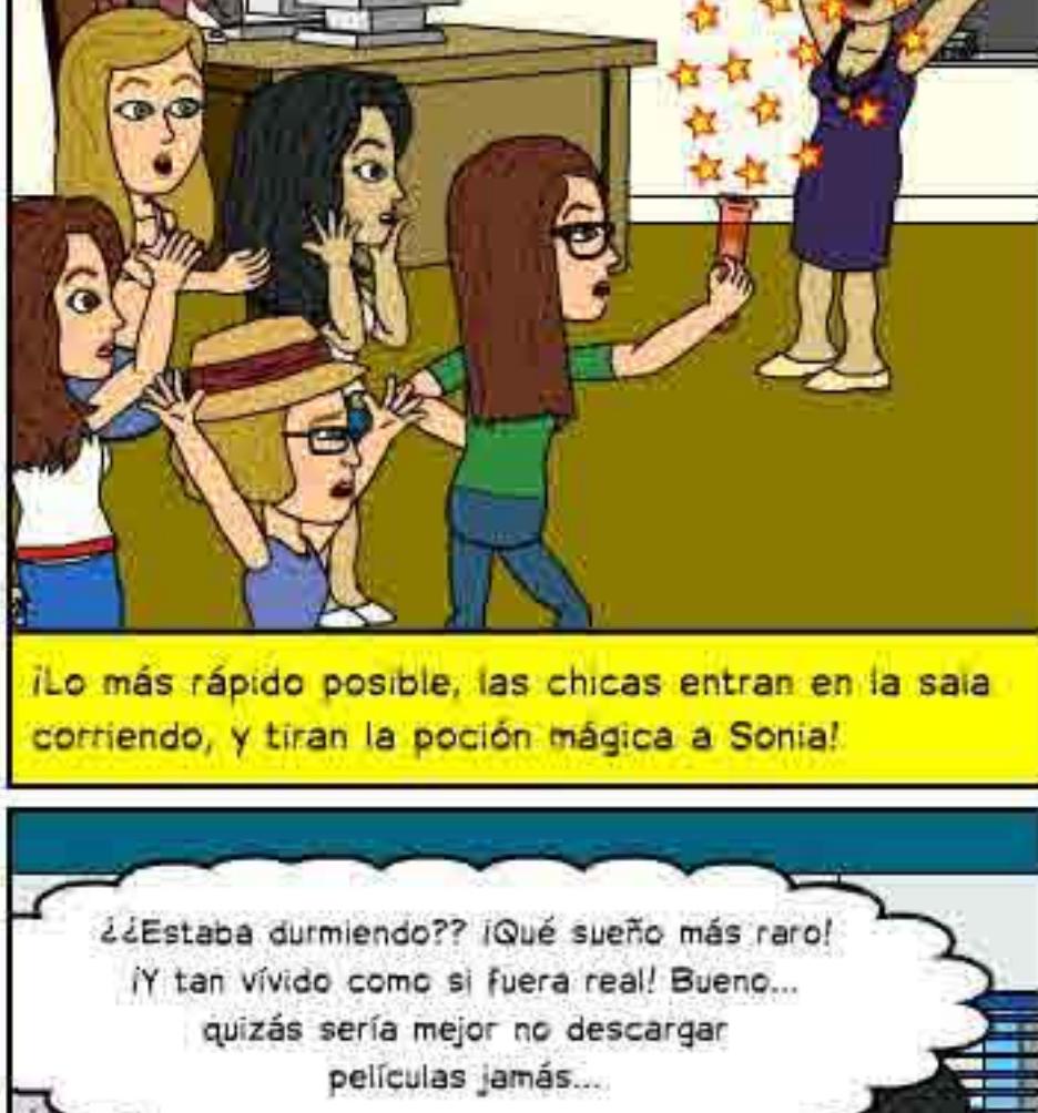
¡Lo más rápido posible, las chicas entran en la sala corriendo, y tiran la poción mágica a Sonia!