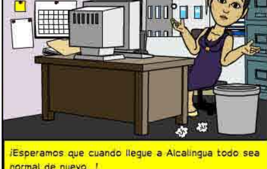
¡Esperamos que cuando llegue a Alcalingua todo sea normal de nuevo...!