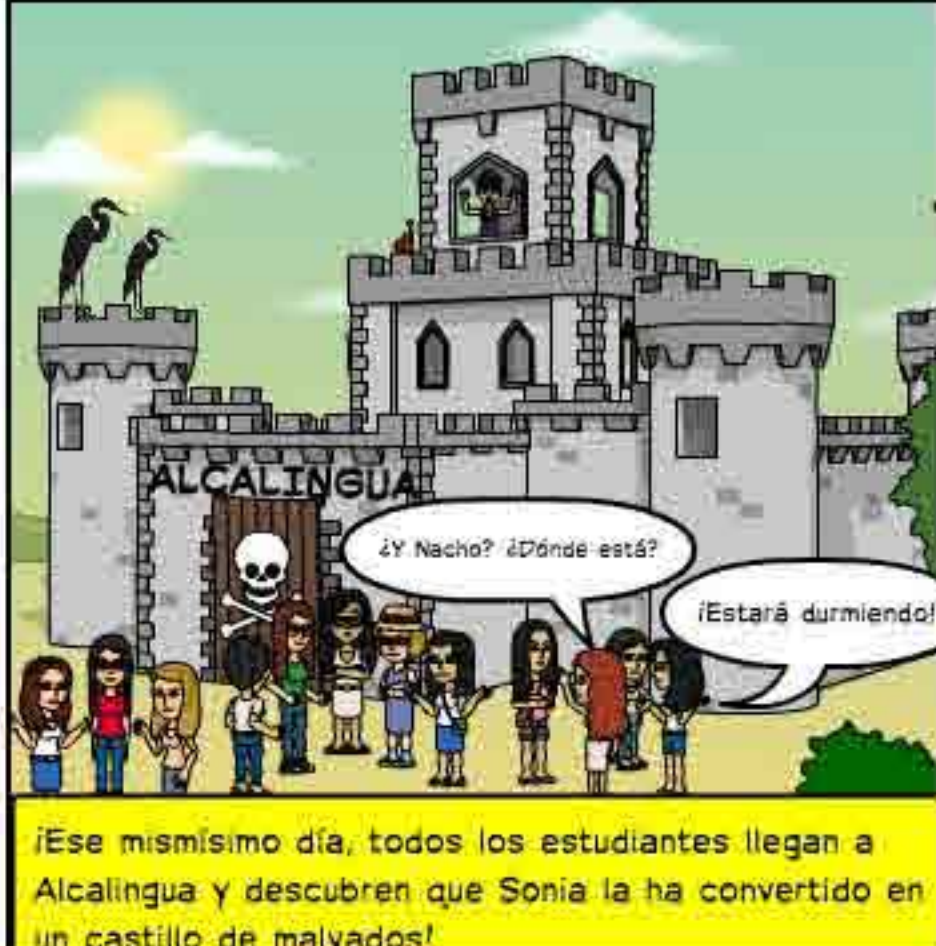
¡Ese mismísimo día, todos los estudiantes llegan a Alcalingua y descubren que Sonia la ha convertido en un castillo de malvados!