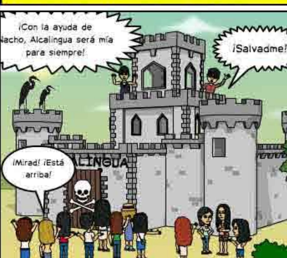
¡La malvada Sonia, para maximizar su poder, ha secuestrado a Nacho para que le ayude!