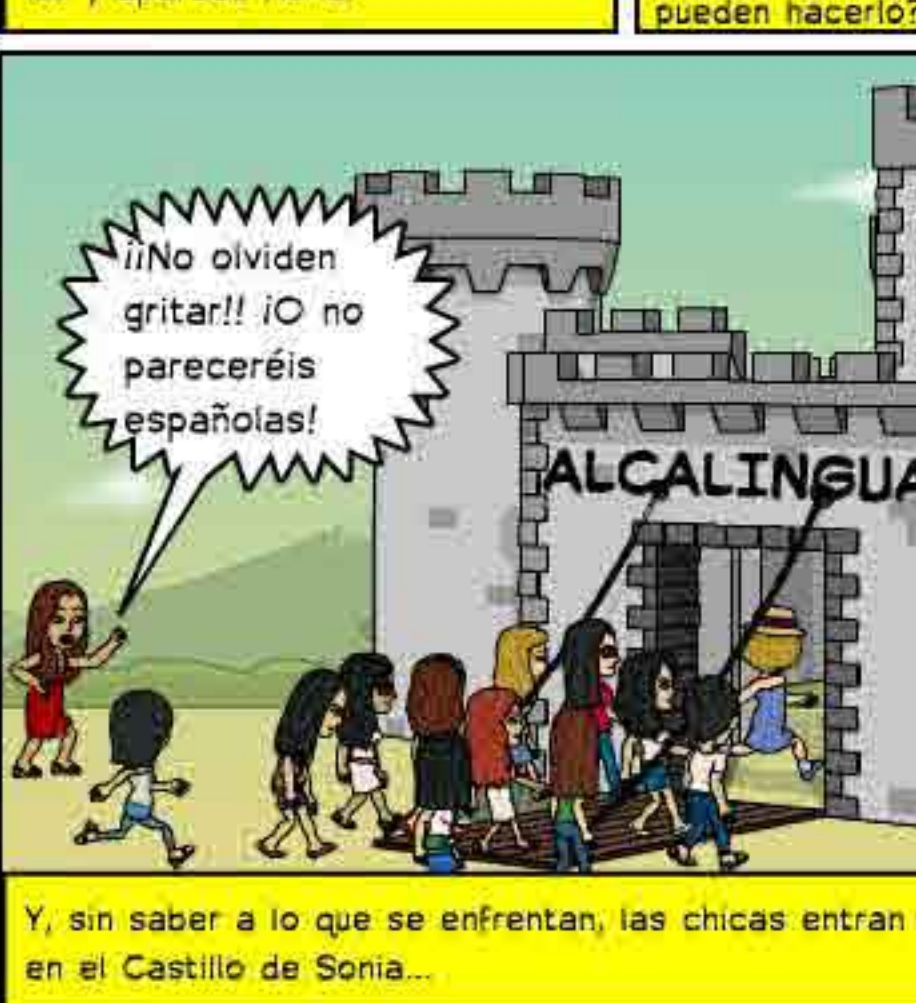
Y, sin saber a lo que se enfrentan, las chicas entran en el Castillo de Sonia...