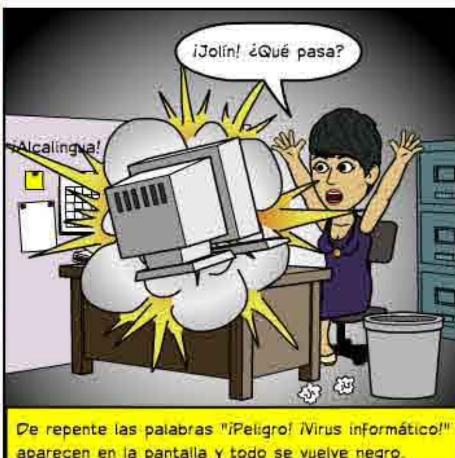
De repente las palabras "¡Peligro! Virus informático!" aparecen en la pantalla y todo se vuelve negro.