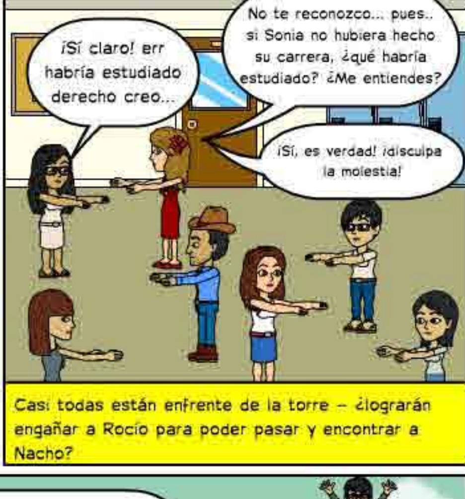
Casi todas están enfrente de la torre - ¿lograrán engañar a Rocío para poder pasar y encontrar a Nacho?