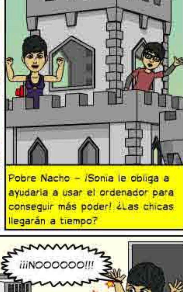
Pobre Nacho - ¡Sonia le obliga a ayudarla a usar el ordenador para conseguir más poder! ¿Las chicas llegarán a tiempo?